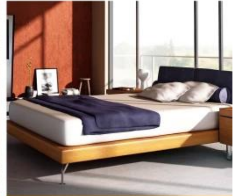
Foot of the bed