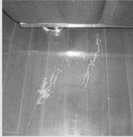
Floor wears when moving furniture