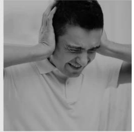
Loud noise when moving furniture