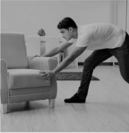
The furniture is too heavy to move