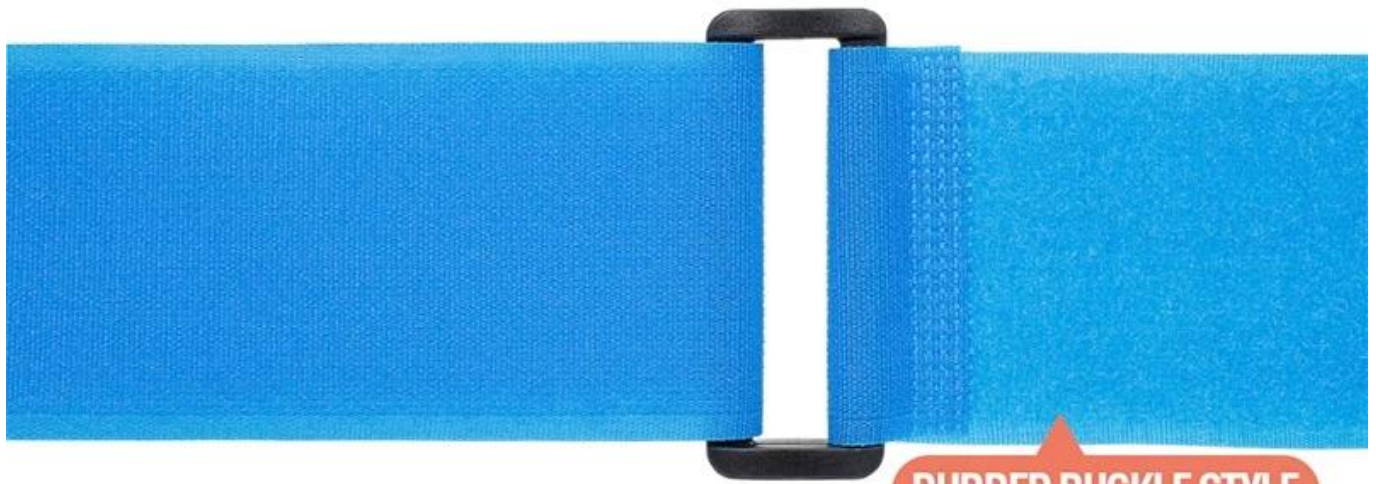
RUBBER BUCKLE STYLE

Iron clasp style and rubber buckle style can be customized It can be adjusted according to your requirement not easy to deform and break