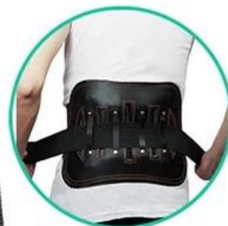
Waist protective belt