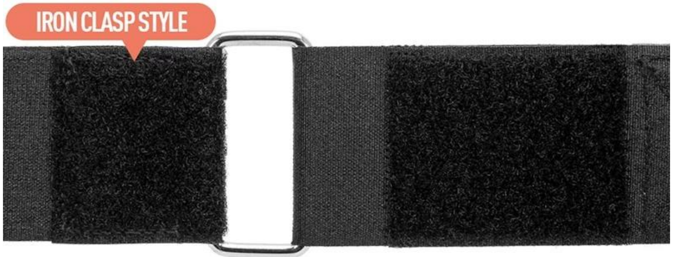
IRON CLASP STYLE

Iron clasp style and rubber buckle style can be customized It can be adjusted according to your requirement not easy to deform and break