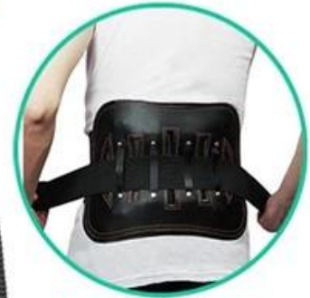
Waist protective belt