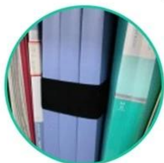
Office document management