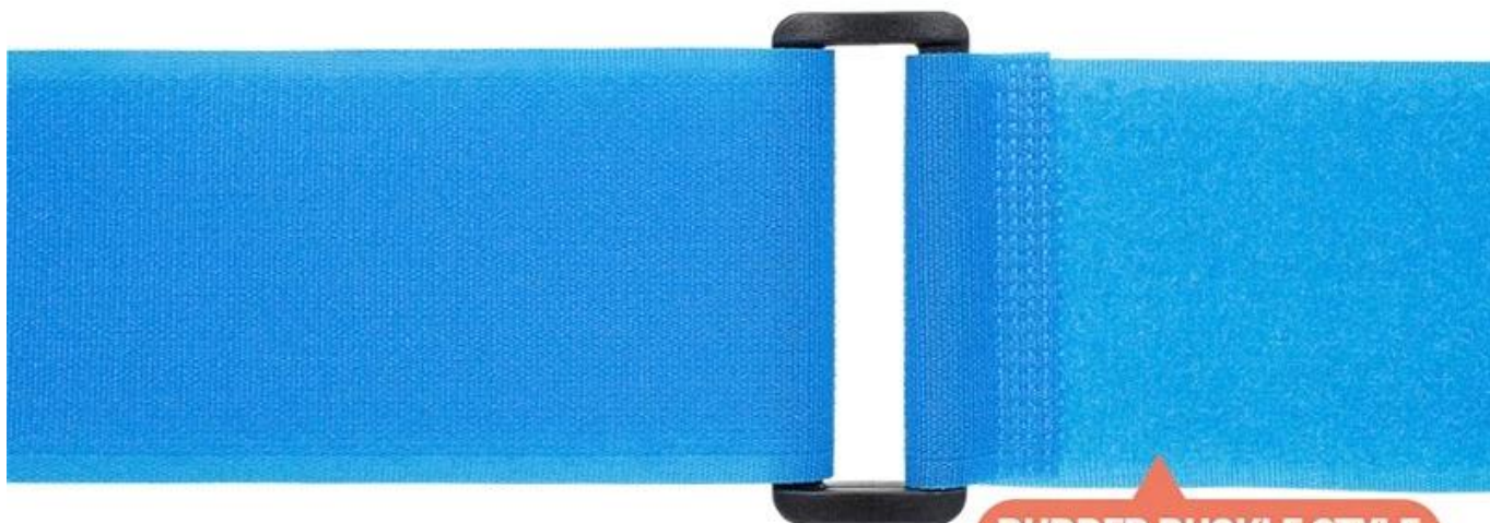
RUBBER BUCKLE STYLE

Iron clasp style and rubber buckle style can be customized It can be adjusted according to your requirement not easy to deform and break