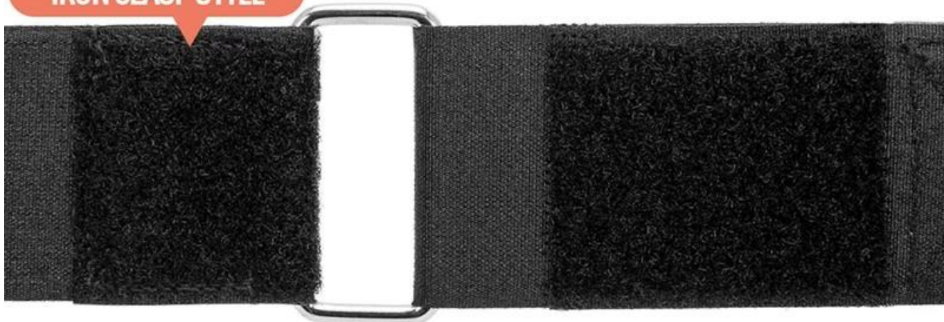
IRON CLASP STYLE

Iron clasp style and rubber buckle style can be customized It can be adjusted according to your requirement not easy to deform and break