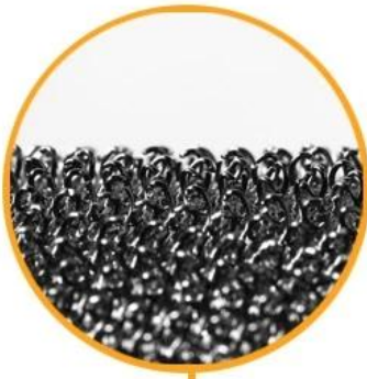
Neat Hook Tape