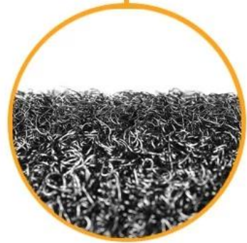
Soft Loop Tape