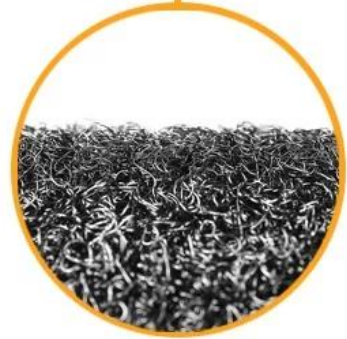
Soft Loop Tape