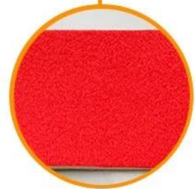
soft loop side