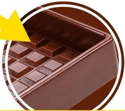
Safe & Sturdy Material