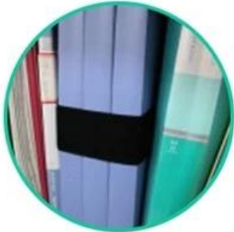
Office document management