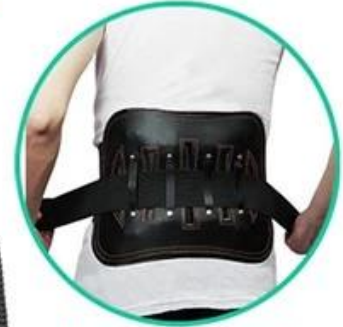
Waist protective belt